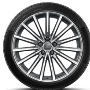
Llanta ligera de aleación de 19" en diseño de radios múltiples, color gris grafito